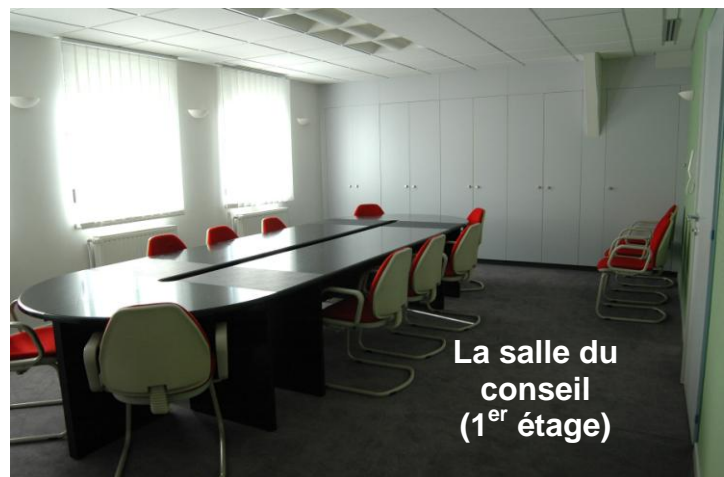
La salle du conseil (1 er étage)

ATTENTION ! Nouveaux horaires à partir du 1 er août 2004 :