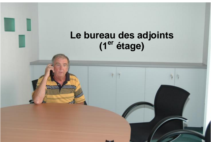
Le bureau des adjoints (1 er étage)