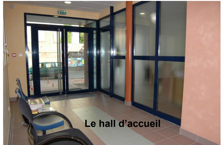
Le hall d'accueil