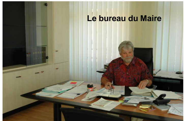
Le bureau du Maire